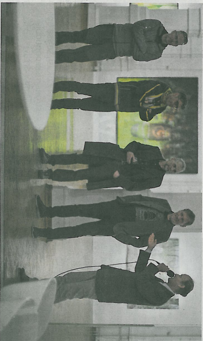
RAZSTAVA V KIBELI