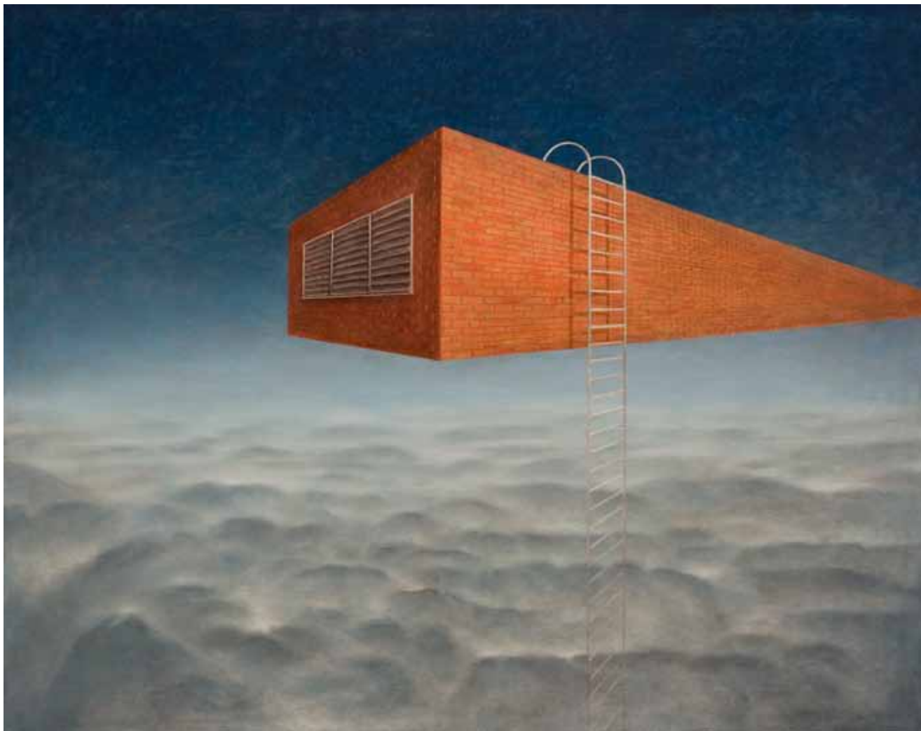
Aleksij Kobal, Catch me if you can , 2012, olje na platnu / oil on canvas, 120×150 cm, foto /photo: Borut Krajnc

atmosfera, ki se naseli vame. Potem sem samo tisti, ki stvari očisti in s pomočjo foto postopkov skuša izraziti jedro slike.