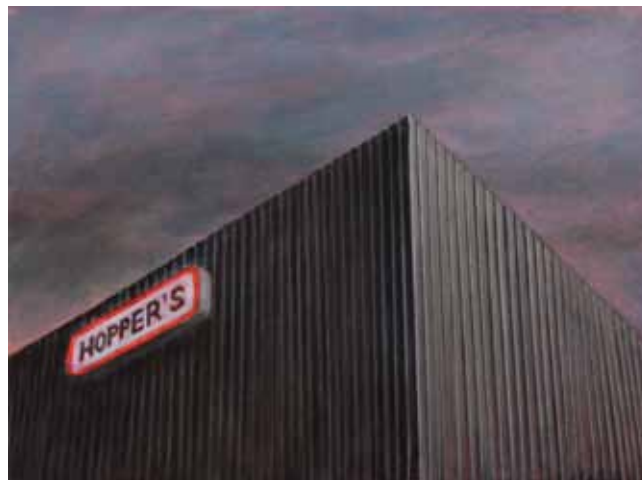
Aleksij Kobal, Hopper's , 2010, olje na platnu / oil on canvas, 30 × 40 cm

Ti oblaki, ki jih srečujemo na tvojih slikah, so torej oblaki, ki jih sam fotografiraš?