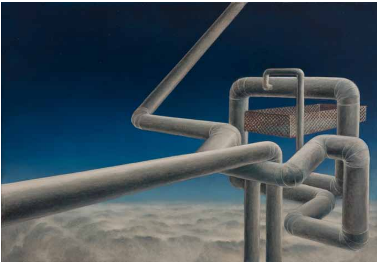
Aleksij Kobal, Izakova daritev – študija / Isac's Sacrifice – study, 2009, olje na platnu / oil on canvas, 75×90 cm, foto /photo: Borut Krajnc

Slika z naslovom Hopper's je posrečen hommage Hopperju, ameriškem slikarju, čigar vpliv slutimo v tvojih slikah. Dober poklon mojstru, ki te je navdihnil.