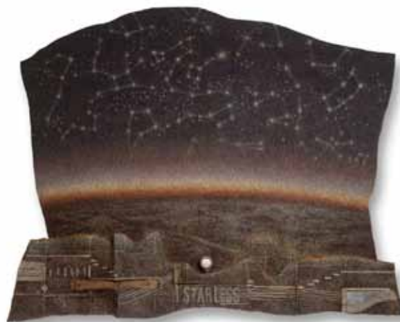
Aleksij Kobal, Starless , 1992, mešane tehnike na platnu / mixed techniques on canvas, 300 × 400 cm, moč v duhovnih kilovatih / power in spiritual kilowatts: 7 SkW 25 SdW

Delno je prisotna, vedno je prepletena tudi s severno arhitekturo. Prav slika Klesijev avtoportret je sestavljena na ta način. To sem naredil povsem podzavestno. Ko sem jo potem gledal, sem se smejal, ker je tako natančen avtoportret. Manjša renesančna fasada je obrnjena k soncu, ki zahaja, vendar nima oken. Ta prikazuje mojo mladost, ki je bila slepa. Drugi del fasade je Kazina iz Ljubljane, ki je v senci, okna pa so odprta. Arhitektura je reminiscenca na koprsko renesanso. Drugače pa so mi blizu industrijske hale. Te arhitekture so kot paravani, niso resnične, so sanjske premise, ki jih samo združim skupaj in se trudim, da nimajo volumna.