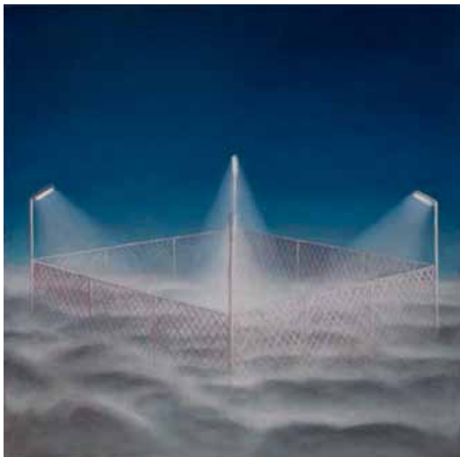
Aleksij Kobal, Območje zajetja / The Area of Capture , študija / study, 2012, olje na platnu / oil on canvas, 50×50 cm, foto / photo: Borut Krajnc

neki način sublimiran. Rad uporabljam absurdno simetrijo ali izometrijo.