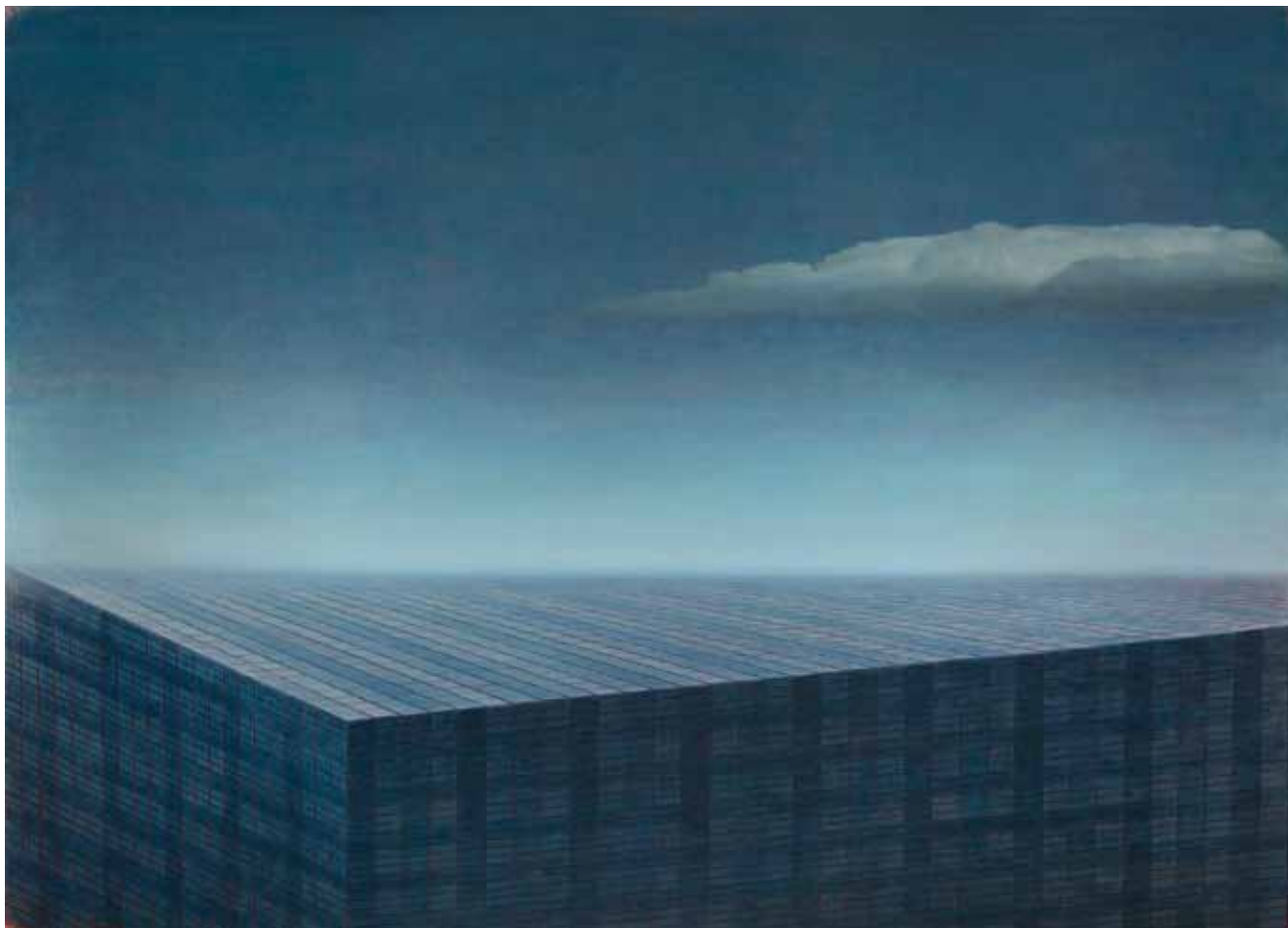
Aleksij Kobal, Menih na obali / Monk on the beach , 2009, olje na platnu / oil on canvas, 200 × 280 cm, European Central Bank Collection

Na neki način tudi sam sebi ne moreš pobegniti.