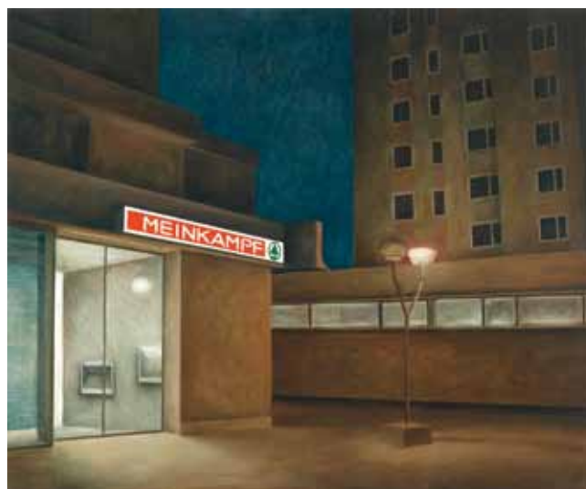
Aleksij Kobal, Meinkampf , 2009, olje na platnu / oil on canvas, 100 × 120 cm, foto /photo: Borut Krajnc