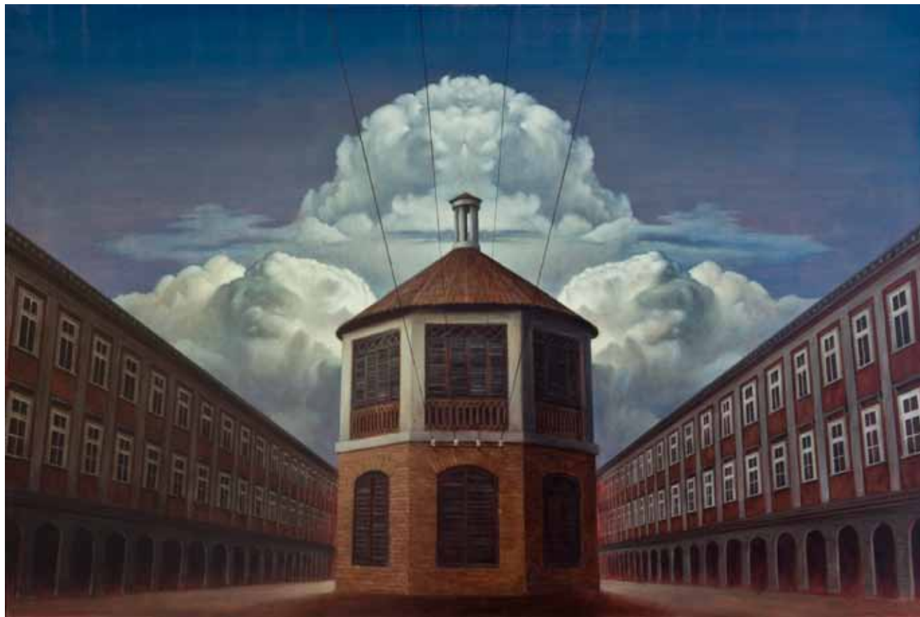
Aleksij Kobal, Idealno mesto / Ideal city , 2010, olje na platnu / oil on canvas, 135 × 200 cm

mu priča v naši državi. Temu pritrjuje dejstvo, da smo v resnici pravi v podzavesti, ne v zavesti. Zavest je privzgojena prek vzgoje, okolja in šole, zato bi se morali preizprašati, kdo smo v resnici. Smo zato umetniki? Rdeča barva, ki jo puščam, da preseva skozi plasti, je prispodoba tega podzemlja, te nezavedne magme, ki sili ven, in na neki način ji moramo dati prosto pot.